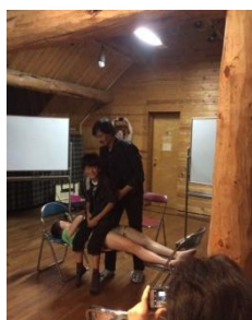
催眠術に掛かる図!

皆さんは「催眠」にかかったことありません？先日参加したアウトドアフェス。夜のイベントの部で開催された、関西睡眠研究所主催「超能力と催眠」に参加してきました。結果、催眠に掛かりました。しっかりと掛かりましたです。ハイ。酔っ払い、かかからないって事前に言われていたのですが(笑)(催眠の前、懇親会で生ビール4杯!)以前、リング検査つてのもやってみて、少し実感できたのですが、今回の催眠はホンマに「あれれ!動かない!」という感じになったわけで。先生曰く「10人に6人はかかり、そのうち、2人ほどはかなり深くかかります」とのこと。この30人の中で確かにかかりやすい人がいて、違う人に催眠掛けているのにも関わらず、勝手にかかっていたりしてるんです。いやあ、いい体験ができました。