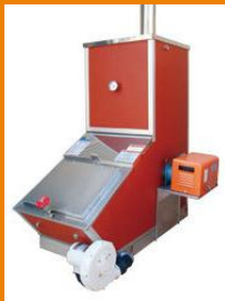
【木質バイオマス給湯器】 ※薪を燃料にします