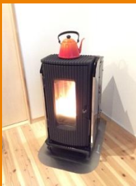
【ペレットストーブ】 さいかい産業RS-4