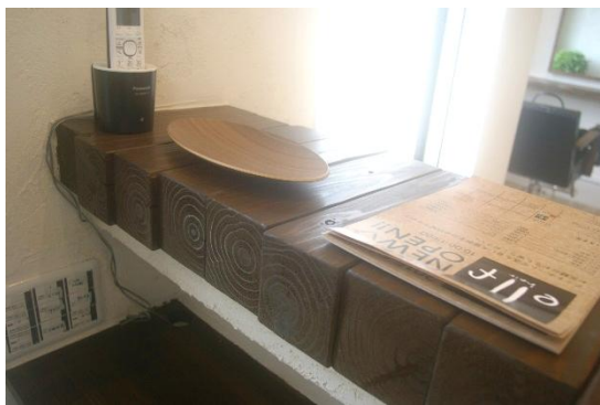
◀ 年輪が見えるカウンター