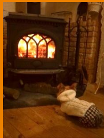
【薪ストーブ】 ヨツールF400・F3