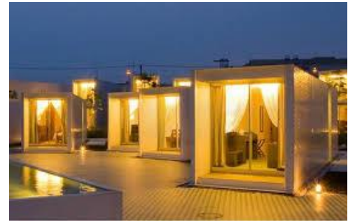
(コンテナハウスのホテル)